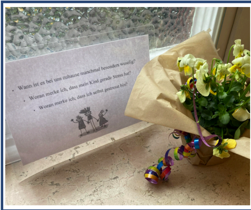
Impressionen Im Hier und Jetzt für Familien 2026

Darauf aufbauend wurde ein digitaler Elternabend durchgeführt, der sich an Eltern richtete und sowohl Informationen zum Thema