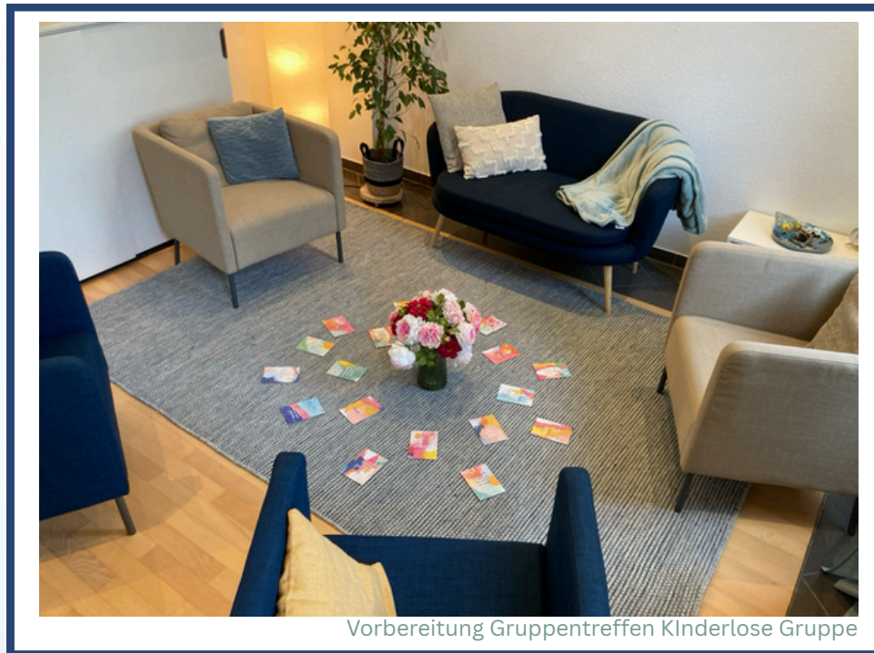
Vorbereitung Gruppentreffen Kinderlose Gruppe

Die Themen in den Gruppen waren vielfältig und orientierten sich an