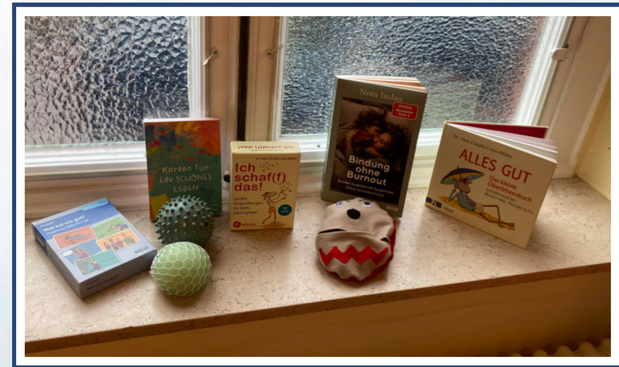
Impressionen Im Hier und Jetzt für Familien 2026

Es wurde deutlich, dass sich Reaktionsweisen von Betroffenen in unterschiedlichen Kontexten ähneln können und ein traumasensibles Verständnis hier eine wichtige Orientierung bietet.