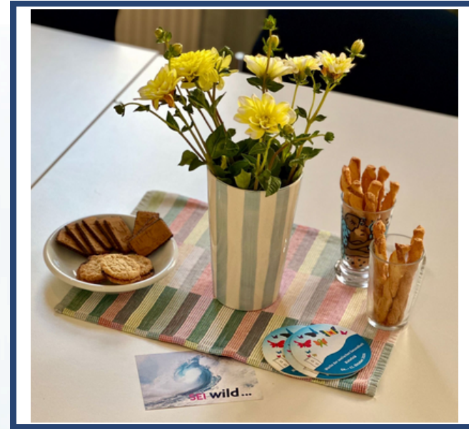
Impressionen Netzwerktag 2024

Insgesamt nahmen 23 Fachkräfte aus unterschiedlichen Bereichen teil, u.a. aus Fachberatungsstellen, Drogenberatung, Eltern-Kind-Wohnen, Begleitete Elternschaft, Erziehungshilfe, Frühe Hilfen, Kinder- und Jugendlichenpsychotherapie, Hebammen, Geburtskliniken sowie weitere psychosoziale und medizinische Arbeitsfelder.