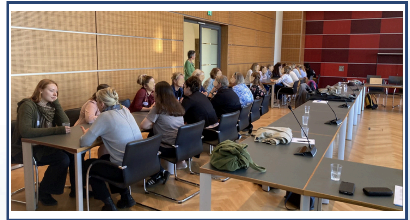
Impressionen Netzwerktag 2024

Wildwasser Bielefeld Arbeitsimpulse Netzwerktag 2024